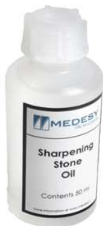
Huile à aiguiser