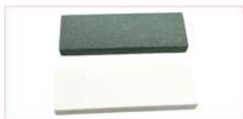
Pierre à aiguiser plate