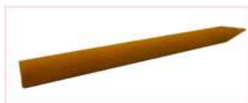
Pierre à aiguiser conique